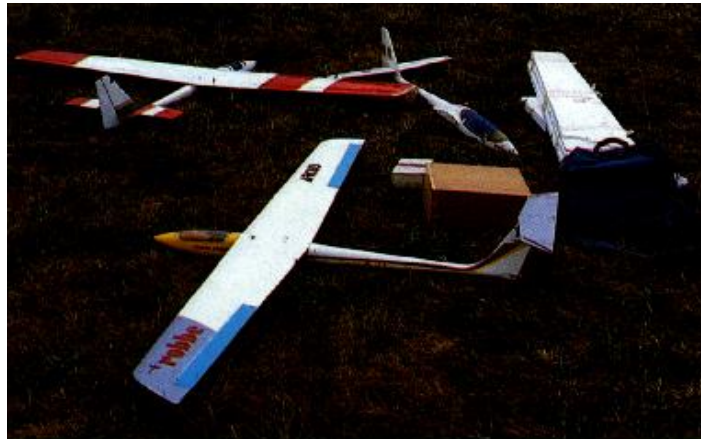
En ladera las alas suelen tener una menor envergadura y alargamiento que en vuelo térmico.

En ladera el vuelo suele ser más rápido, cosa en parte forzada por tener que volar a mayor velocidad que el viento y disponer de capacidad de penetración aerodinámica (léase: tener velocidad punta). La consecuencia de la necesidad de disponer de perfiles con escasa resistencia al avance (para conseguir velocidad) y de disponer de ascendencia constante hace que salvo en los modelos elementales es poco frecuente el empleo de perfiles plano-convexos, ampliamente utilizados en vuelo térmico; la mayoría de los modelos utiliza perfiles semi simétricos, y los modelos especiales para acrobacia pueden usarlos simétricos, cosa impensable en un velero de llano por su escasa sustentación.